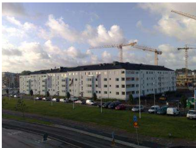
Figur 1. Foto av Hamnhuset

Med tanke på att ingen genomfört ett passivhus av Hamnhusets storlek i Sverige fanns ingen entreprenör eller konsult som hade erfarenheter om hur det skulle kunna genomföras. Projekteringen blev därmed omfattande och flera omtag togs under vägen. Faktum är att Hamnhuset först startades som ett normalt bostadshus och efter ett par månaders projektering togs beslutet att göra om allt för att istället bygga ett passivhus. Utan modet att stoppa projekteringen för att göra omtag hade Hamnhuset inte blivit vad det idag är.