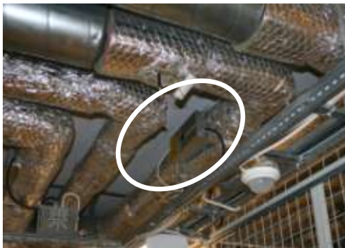
Figur 3. Eldrivna värmebatterier i Hamnhusets källare

I Hamnhuset används luftburen värme uppdelad i två steg. I första steget värms luften av fjärrvärme i ett stort värmebatteri som justeras av fastighetssägaren, det andra steget består av små eldrivna luftvärmare som styrs av de enskilda hyresgästerna. Ska lägenhetsindividuell värme tillföras via tilluften ska värmarna sitta så nära varje lägenhet som möjligt. Mätningar från Hamnhuset visar att mycket energi går förlorad i form av kanalförluster. Detta är framförallt olyckligt om hyresgästerna betalar för den extra värmen och en stor del av den tillförda energin försvinner innan den når lägenheten.