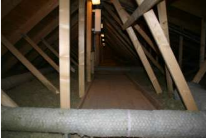
Figur 4. Kanaldragningar på Hamnhusets vind.

Varma kanaldragningar genom kalla garage och på kalla vindar bör undvikas, men om detta ändå måste göras ska isoleras mycket väl.