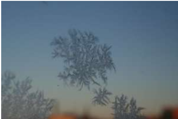
Figur 2. Kondens som fryst på ett fönster i Hamnhuset.

Även vid ett så högt U-värde som 1,1 förekommer kondens på utsidan av fönstren, främst under klara sensommarmorgnar. Detta har rapporterats som ett problem av vissa hyresgäster innan de fått förklarat varför det uppstår och att det är helt naturligt under vissa väderförhållanden.